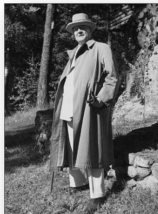
Ο Jean Sibelius στην οικία του 'Ainola'