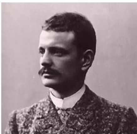
Ο Jean Sibelius κατά τη διάρκεια των μουσικών του σπουδών στη Βιέννη

του τότε ρωσοκρατούμενου «Μεγάλου Δουκάτου της Φινλανδίας». Εκεί ο Ζαν Σιμπέλιους ενετρώφησε για πρώτη φορά στο φινλανδικό λογοτεχνικό corpus, και ιδιαίτερος στην « Καλεβάλα » το εθνικό- μυθολογικό έπος της Φινλανδίας, δημιούργημα του διαπρεπούς φυσικού- βοτανολόγου και γλωσσολόγου, Elia Lönnrot (1802-1884). Αν και τον προόριζαν για σταδιοδρομία νομικού, εντούτοις ο Σιμπέλιους εγκαταλείπει τις σπουδές του στο πανεπιστήμιο του Ελσίνκι και αφοσιώνεται αποκλειστικά στις μουσικές του σπουδές (1885-1889), ενώ παράλληλα παρακολουθεί μαθήματα βιολιού από τον καθηγητή Τσίλαγκ, στο Ινστιτούτο Μουσικής του Ελσίνκι (νυν Ακαδημία Σιμπέλιους), όπου και έχει την τύχη να σταθεί κοντά σε έναν από τους επιφανέστερους- για την εποχή εκείνη- μουσικολόγους· το συνθέτη Martin Wegelius . Το 1889, σε ηλικία 25 ετών περίπου, εγκαταλείπει την Φινλανδία για να συνεχίσει τις σπουδές του στο Βερολίνο πλάι στον Albert Becker , ενώ το επόμενο έτος (1890-91) θα